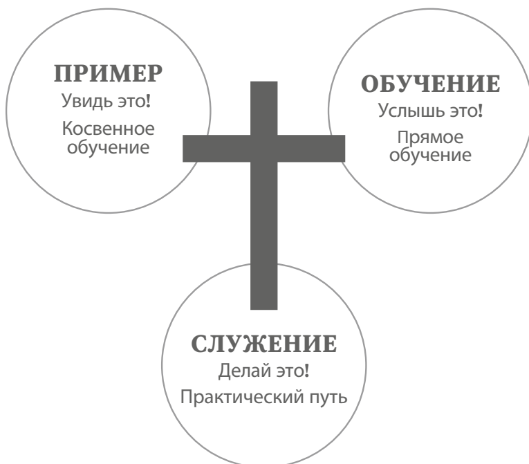
Рис. 1. Формирование мировоззрения вашего ребенка через личный пример, обучение и служение

о мире и ответы на самые глубокие вопросы жизни 3 . Кто я? Зачем я здесь? Откуда я? Куда я иду? Что правильно и что неправильно? Кто такой Бог?